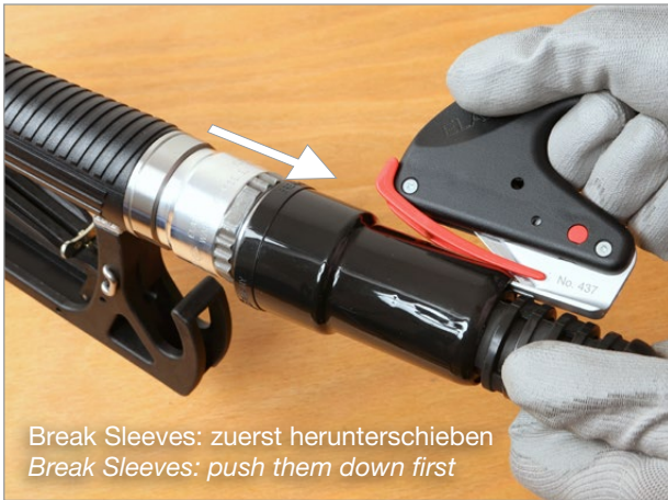
Break Sleeves: zuerst herunterschieben Break Sleeves: push them down first