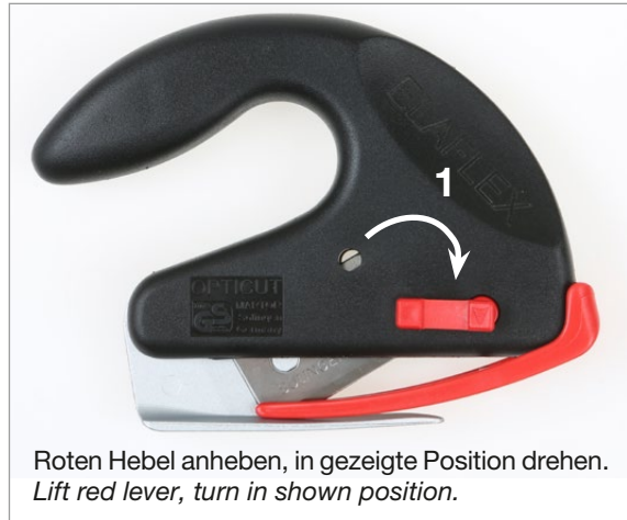
Roten Hebel anheben, in gezeigte Position drehen. Lift red lever, turn in shown position.

Attention - wear cut-protective gloves and do not touch the cutting surface of the blade.