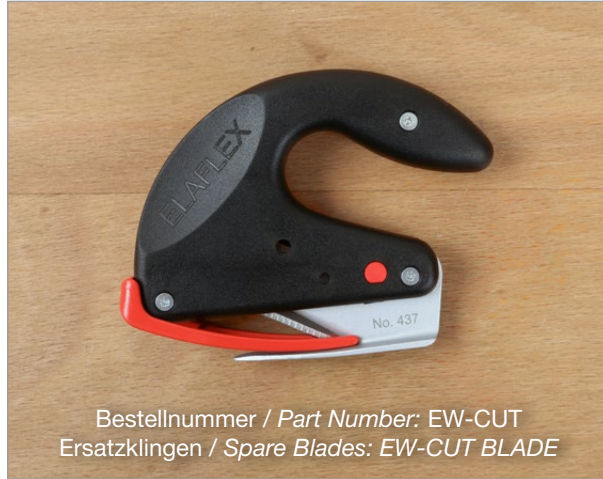
Bestellnummer / Part Number: EW-CUT Ersatzklingen / Spare Blades: EW-CUT BLADE

Sicherheitsregeln zum Herunterschneiden von alten Schutzüberzügen oder Break / Colour Sleeves: Please observe these safety rules when cutting off old scuffguards or Break / Colour Sleeves: