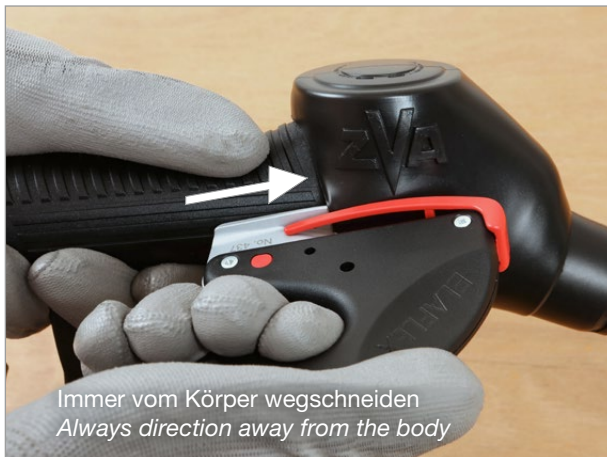
Immer vom Körper wegschneiden Always direction away from the body