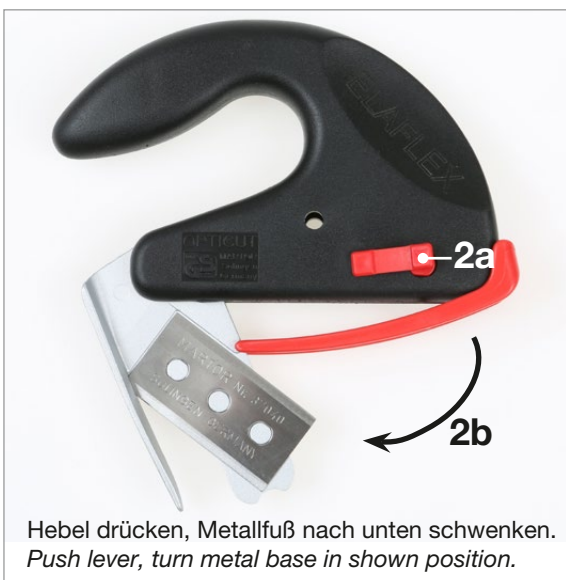
Hebel drücken, Metallfuß nach unten schwenken. Push lever, turn metal base in shown position.